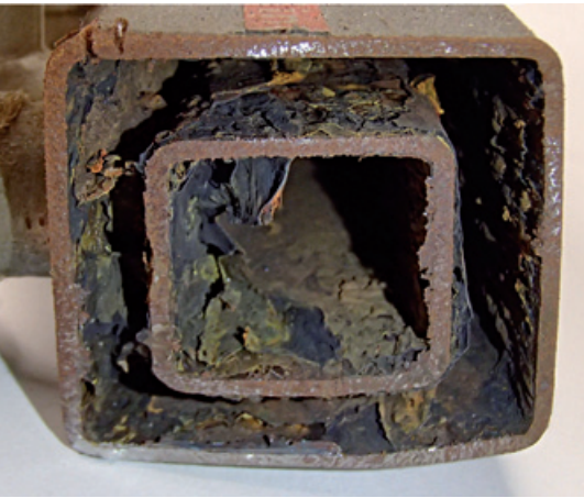
➤ Schnitt durch einen korrodierten Wohnungsverteiler aus Stahl

Während die Radiatoren- und Decken- sowie die ersten Fussbodenheizungen aus Stahlrohren generell keine grösseren Probleme bezüglich Verschlämmung verursachen, wurde der Einsatz von Kunststoffrohren vermehrt zur Problematik. Schon Ende der 70er, Anfangs der 80er Jahre traten vermehrt Probleme mit Bodenheizungen auf. Es stellte sich heraus, dass dies praktisch ausschliesslich mit Fussbodenheizungen aus Kunststoffrohren der Fall war. Nach intensiven Untersuchungen konnte erwiesen werden, dass die Verschlämmung die Ursache einer dauernden Sauerstoff Diffusion in das Heizsystem, ist.