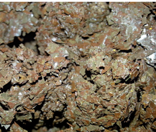
➤ Korrosionspartikel aus Bodenheizungsrohren

Unter Korrosion versteht man die Zerstörung von Werkstoffen durch chemische oder elektrochemische Reaktion mit ihrer Umgebung. In der Heizungsanlage wird durch die elektrochemische Reaktion der Stahl abgebaut.